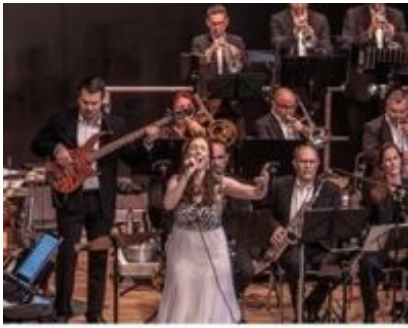
and Central Bigband