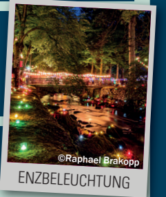
ENZBELEUCHTUNG