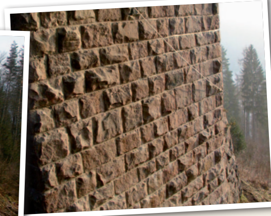
Neu verfügte Widerlagerwand Nord