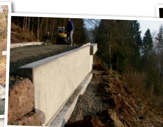
Neue Stützwand Südost