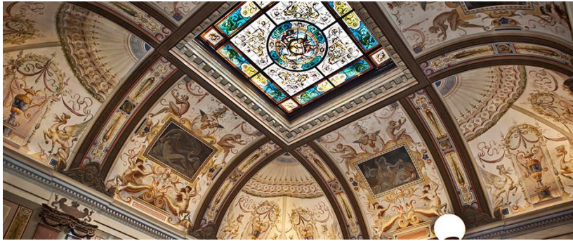
Forum König-Karls-Bad: Königlich Tagen zwischen Tannen & Thermen